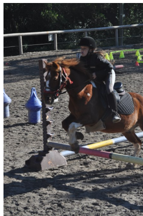
Candince dans la chicane