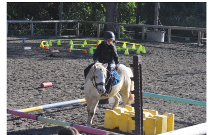
Juliette dans la chicane