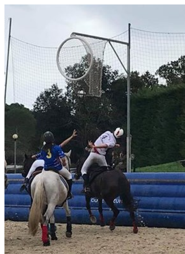
Chistera de Nicolas