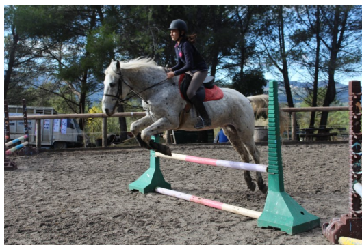
Lana sur Javelot